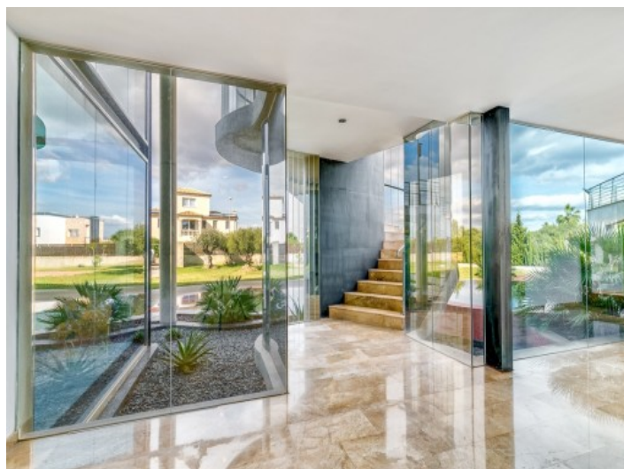
Garden and pool views from the ground floor

All information is correct to the best of our knowledge. Errors and prior sale excepted. This prospectus is purely for information purposes. Only the notarized deed of sale is legally binding.