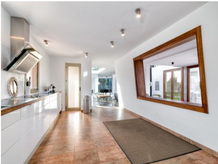
Modern and spacious kitchen