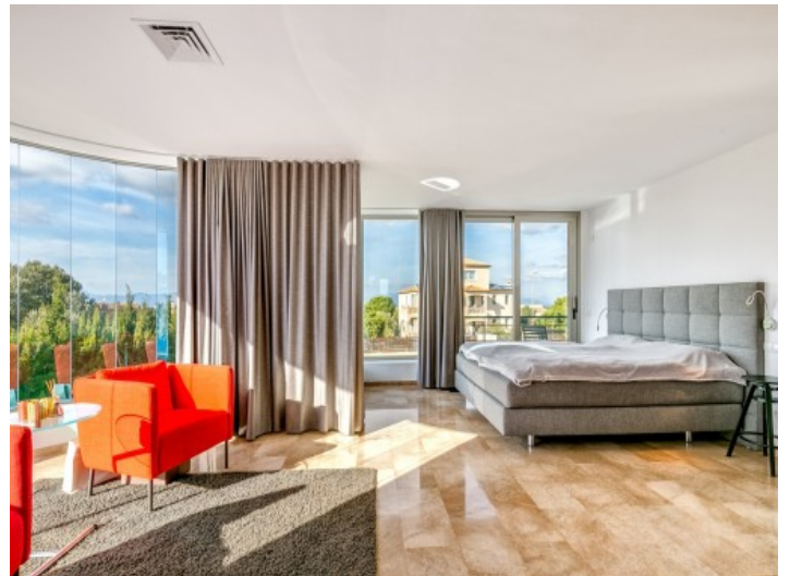
Capacious master bedroom with fantastic glass façade

All information is correct to the best of our knowledge. Errors and prior sale excepted. This prospectus is purely for information purposes. Only the notarized deed of sale is legally binding.