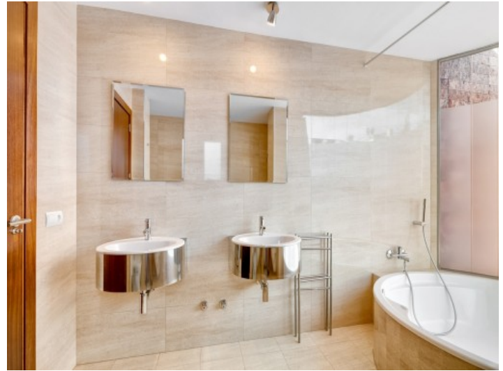
Noble bathroom with bathtub and natural light