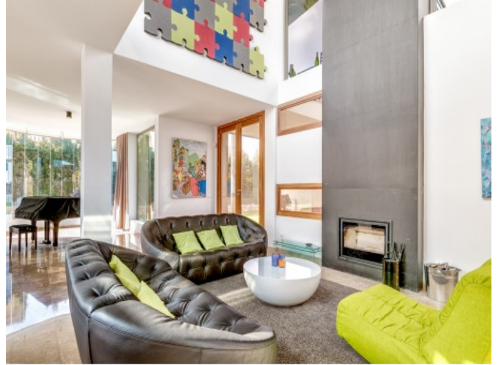
Light flooded living area with fireplace