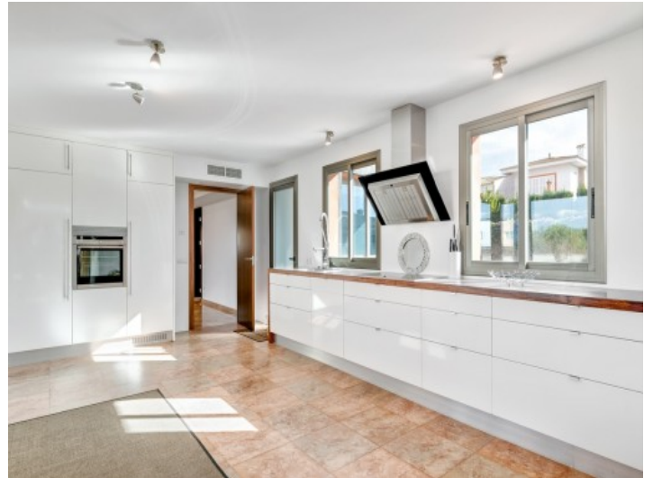
Fully equipped kitchen