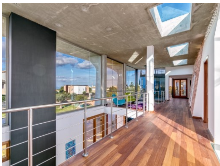
Extensive gallery with lounge area