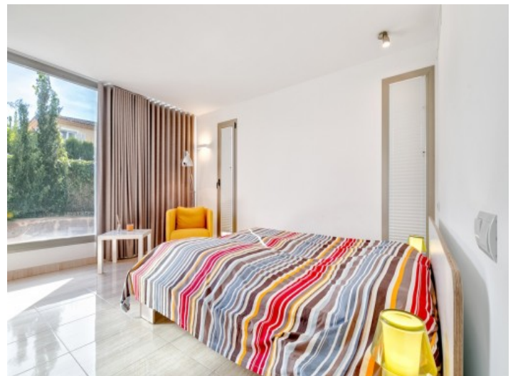
Friendly guest bedroom

All information is correct to the best of our knowledge. Errors and prior sale excepted. This prospectus is purely for information purposes. Only the notarized deed of sale is legally binding.