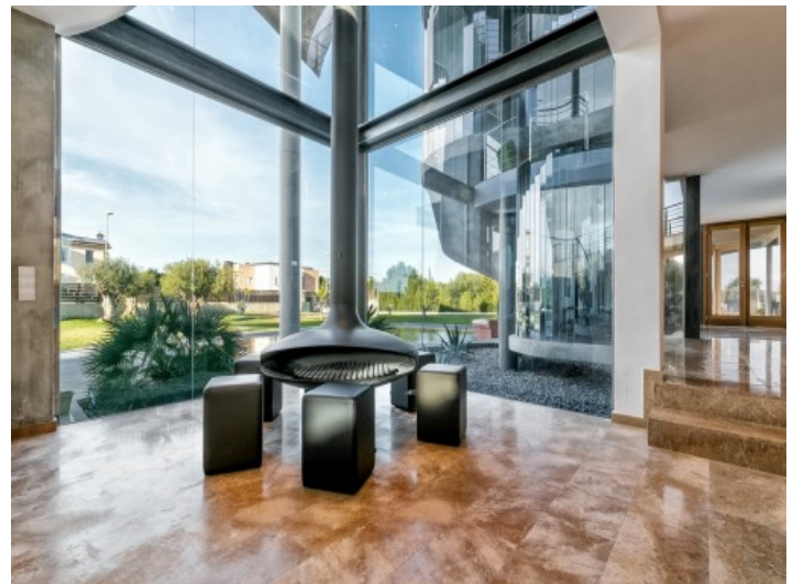
Stylish chillout area with garden views and fireplace