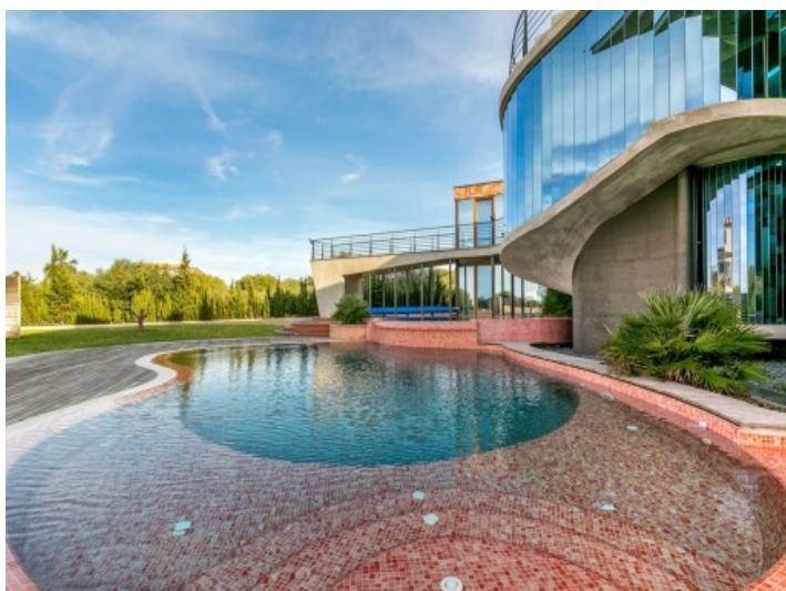
Breathtaking pool area