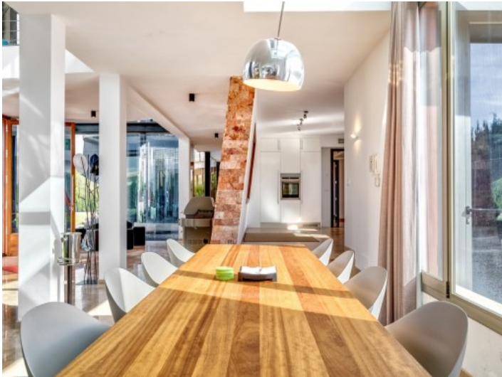
Large dining area