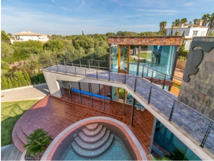
Great garden and pool area