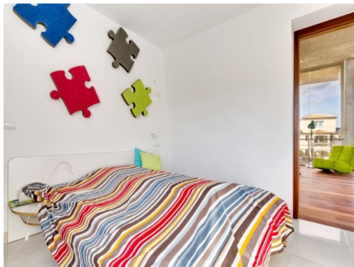
A further double bedroom on the upper floor