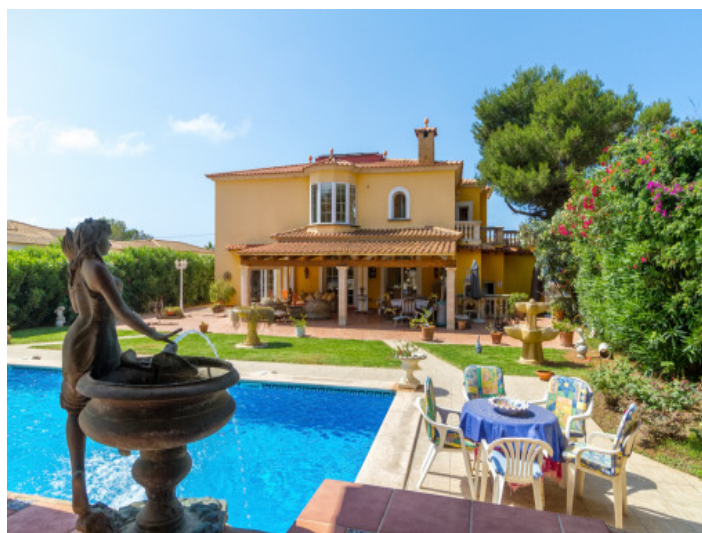
Inviting sun loungers at the pool area