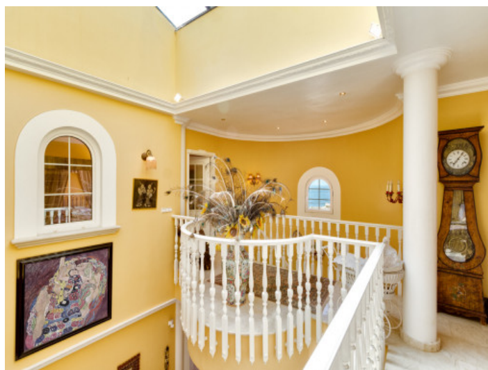
Views of the gallery