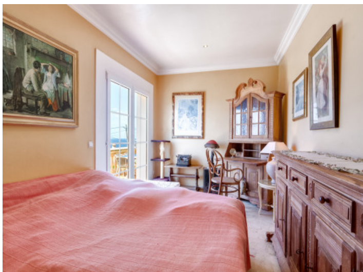
The villa offers 3 bedrooms