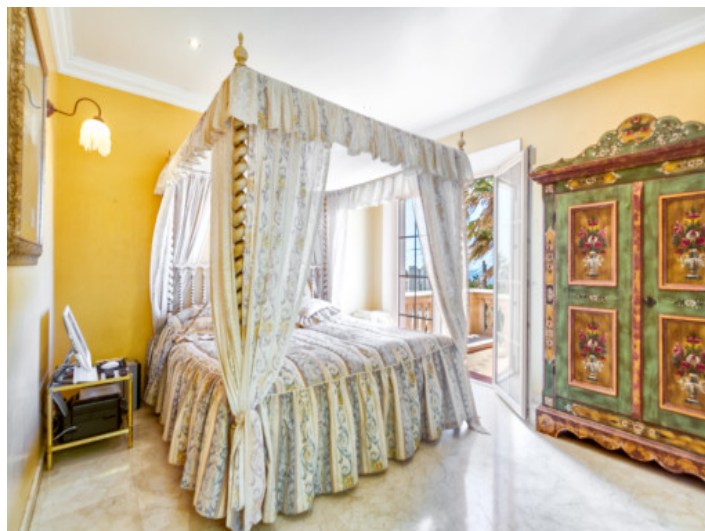
Master bedroom with access to the balcony