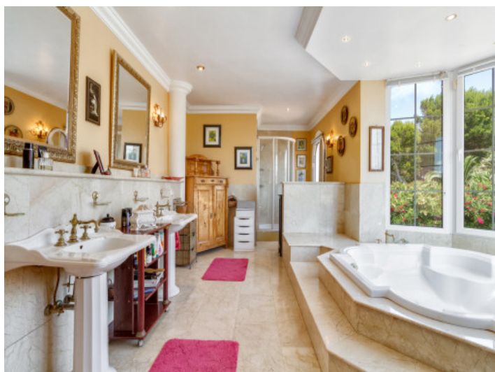
The bathroom is flooded with daylight