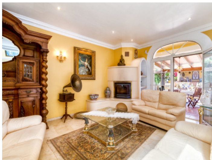
Cosy fireplace in the lounge area

All information is correct to the best of our knowledge. Errors and prior sale excepted. This prospectus is purely for information purposes. Only the notarized deed of sale is legally binding.