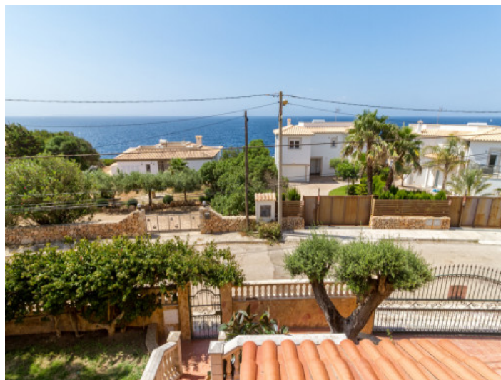
Sea views from the balcony