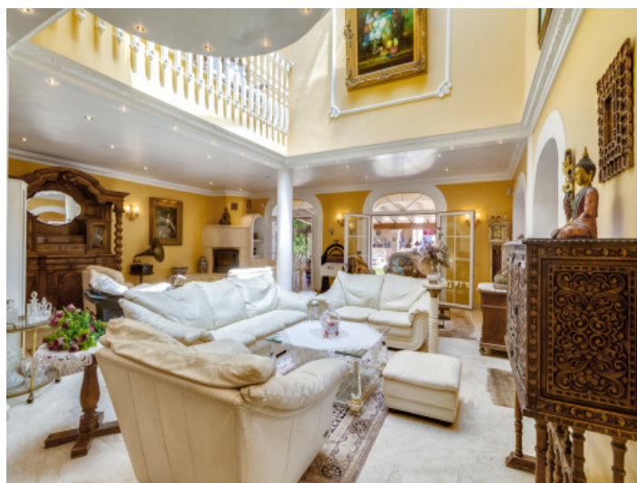
Open living area and gallery