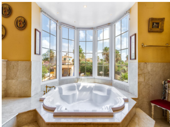
Noble bathroom with jacuzzi

All information is correct to the best of our knowledge. Errors and prior sale excepted. This prospectus is purely for information purposes. Only the notarized deed of sale is legally binding.