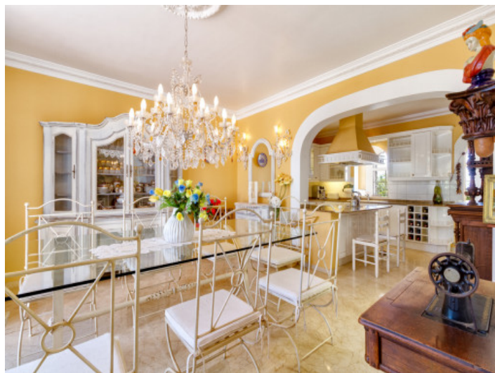
Dining area next to the kitchen