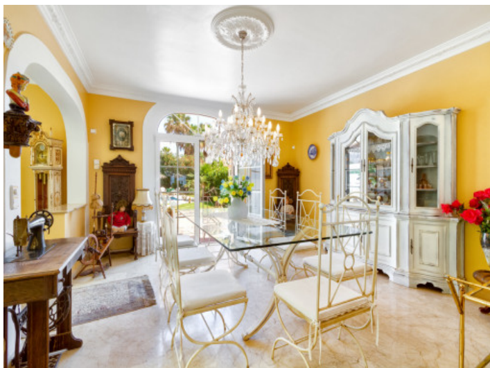
Garden access from the kitchen area