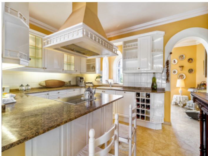
Fully equipped kitchen with cooking island