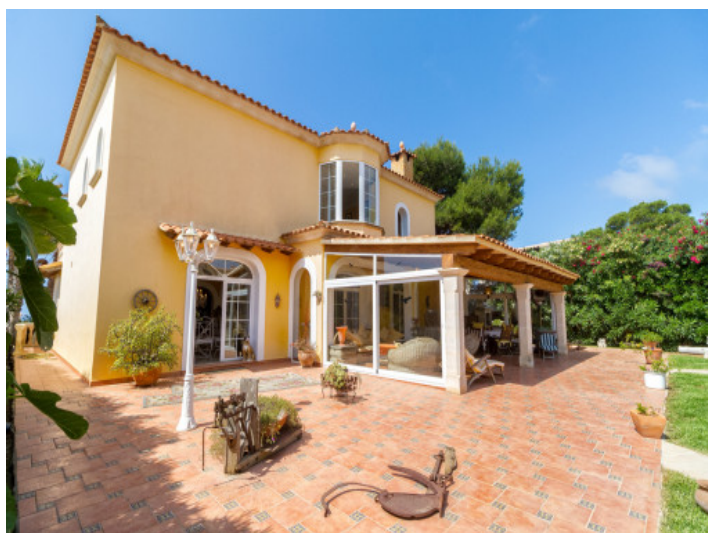
Exterior views and garden