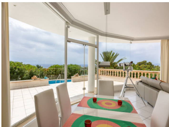
Bright dining area