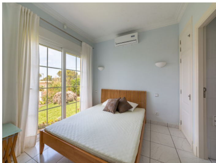
Bedroom with air condition

All information is correct to the best of our knowledge. Errors and prior sale excepted. This prospectus is purely for information purposes. Only the notarized deed of sale is legally binding.