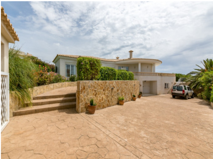
Fantastic outdoor area