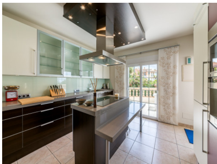
Kitchen with cooking island