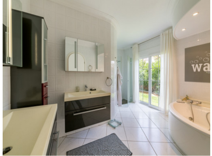
Bright bathroom with bathtub