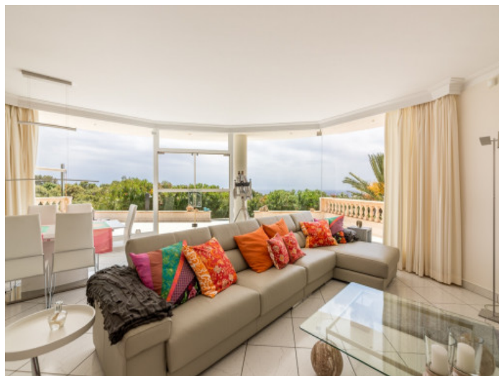
Light flooded living area