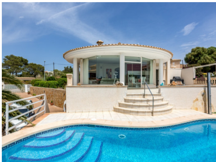
Inviting pool area