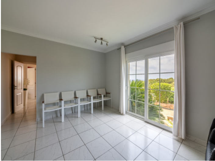
Bedroom with panoramic windows