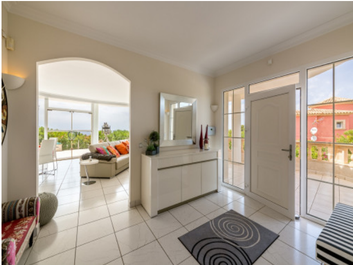
Entrance of the villa